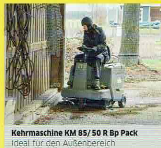
Kehrmaschine KM 85/50 R Bp Pack Ideal für den Außenbereich