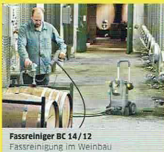
Fassreiniger BC 14/12 Fassreinigung im Weinbau