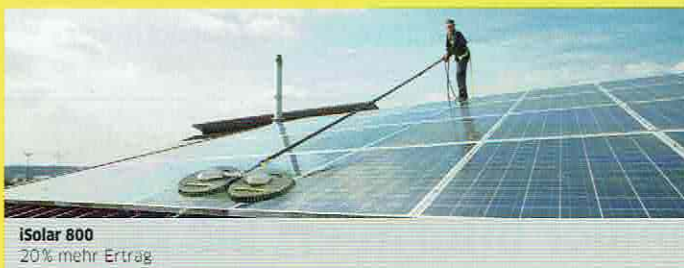
iSolar 800 20% mehr Ertrag