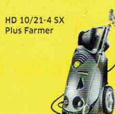
HD 10/21-4 SX Plus Farmer