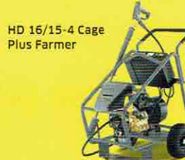
HD 16/15-4 Cage Plus Farmer