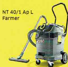
NT 40/1 Ap L Farmer