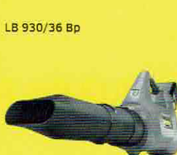
LB 930/36 Bp