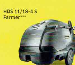
HDS 11/18-4 S Farmer***